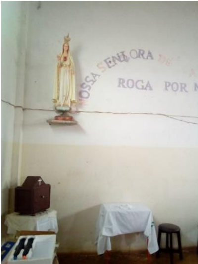
A paróquia do Chiange Gambos sede

do Clero Diocesano. Este saiu da sede porque o Governo já queria ocupar o espaço e para defender reside cá acolhe os seminaristas em férias ou não e vai assistindo a paróquia de Nossa Senhora de Fátima aliás as celebrações são rotativas porque ele continua pároco. Estou certa que falei mais do que podia.