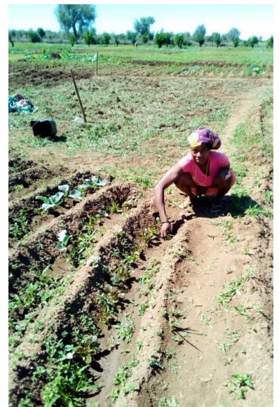
Estou ajudar a porção duma mãe. A lavra da Associação Tunda I