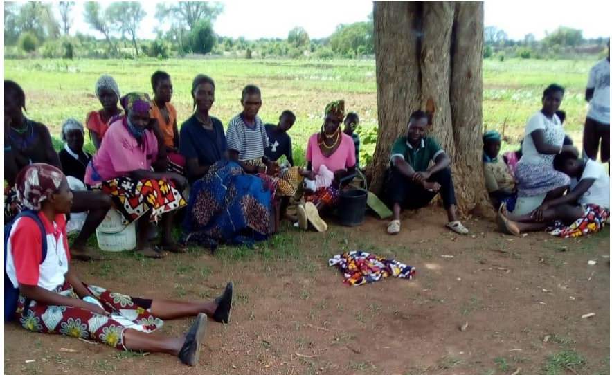
Encontro com as mães na mesma associação