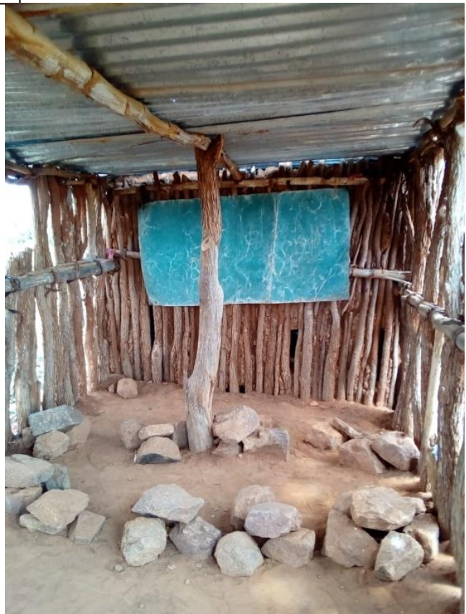
Este é o interior da sala de aula.

Um Abraço a todas e continuação de Boas Festas.