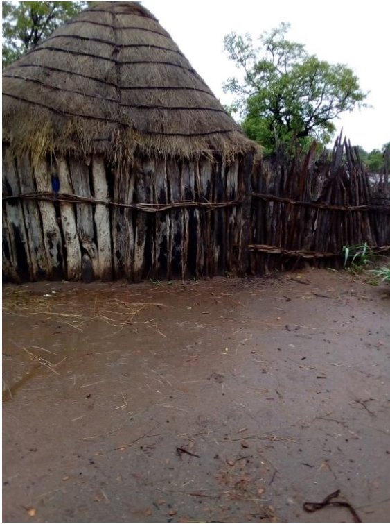
O dia seguinte da minha chegada chovia está é casa dentro do limbo que é conjunto de famílias